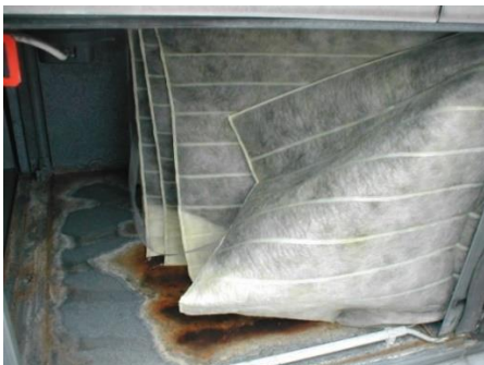
Foto: Filter in einer RLT-Anlage

In bis zu 30 % der Bürogebäude arbeiten Beschäftigte, die unter dem sick-building-syndrom (gebäudebezogene Befindlichkeitsstörungen bei mindestens 20 % der Personen) leiden. Die Kosten der diesbezüglichen Arbeitsunfähigkeit und dem damit verbundenen Produktivitätsverlust werden auf mehrere Milliarden Euro geschätzt.