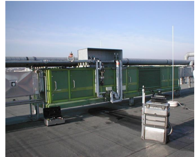
Foto: RLT-Anlage Dachgerät

Nach VDI 6022 sind bei RLT-Anlagen mit Luftbefeuchtung alle 2 Jahre und bei Anlagen ohne Luftbefeuchtung alle 3 Jahre Hygieneinspektionen durchzuführen.