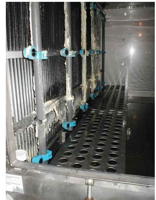
Foto: Sprühbefeuchter in einer RLT-Anlage

Auch Altanlagen unterliegen der VDI 6022. Ein Bestandsschutz hinsichtlich technischer Anpassungen gilt nur dann, wenn nachgewiesen wird, dass von der RLT-Anlage keine gesundheitlichen Gefährdungen resultieren. Dieser Nachweis erfolgt durch die obligatorische Hygieneinspektion in Kombination mit der Gefährdungsbeurteilung.