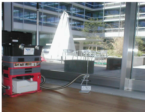
Foto: Mikrobiologische Luftmessung

In bis zu 30% der Bürogebäude arbeiten Beschäftigte, die unter dem sick-building-syndrom (gebäudebezogene Befindlichkeitsstörung bei mindestens 20% der Personen) leiden. Die Kosten der diesbezüglichen Arbeitsunfähigkeit und dem damit verbundenen Produktivitätsverlust werden auf mehrere Milliarden Euro geschätzt.