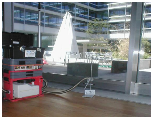
Foto: Mikrobiologische Luftmessung

In bis zu 30% der Bürogebäude arbeiten Beschäftigte, die unter dem sick-building-syndrom (gebäudebezogene Befindlichkeitsstörung bei mindestens 20% der Personen) leiden. Die Kosten der diesbezüglichen Arbeitsunfähigkeit und dem damit verbundenen Produktivitätsverlust werden auf mehrere Milliarden Euro geschätzt.