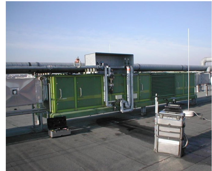
Foto: RLT-Anlage Dachgerät

Nach VDI 6022 sind bei RLT-Anlagen mit Luftbefeuchtung alle 2 Jahre und bei Anlagen ohne Luftbefeuchtung alle 3 Jahre Hygieneinspektionen durchzuführen.